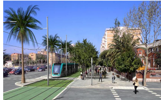
Marquès de Montroig